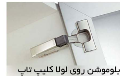
بلوموشن روی لولا کلیپ تاپ

بلوموشن روی لولا جهت نصب روی لولای کلیپ تاپ و بلوموشن صلیبی جهت نصب بر روی بدنه کابینت هایی که از لولایی غیر از لولا کلیپ تاپ استفاده میکنند ، طراحی شده اند. آرامبند مدادی نیز برای نصب نیاز به سوراخکاری لبه بدنه کابینت دارد.